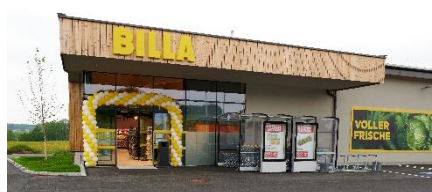
Bilder+Text: REWE Group